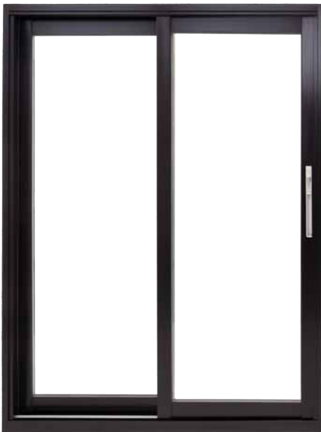
plus la Moustiquaire "Robusto"